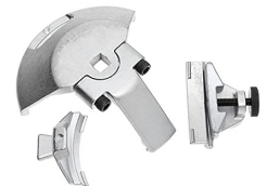
HERRAMIENTA STRETCH FIT® 91088 (CHEVROLET)