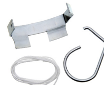
HERRAMIENTA STRETCH FIT® 91087 (VW)